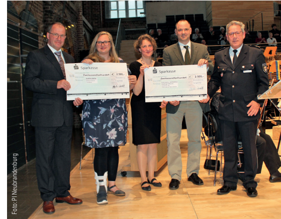
Scheckübergabe an die beiden Vereine